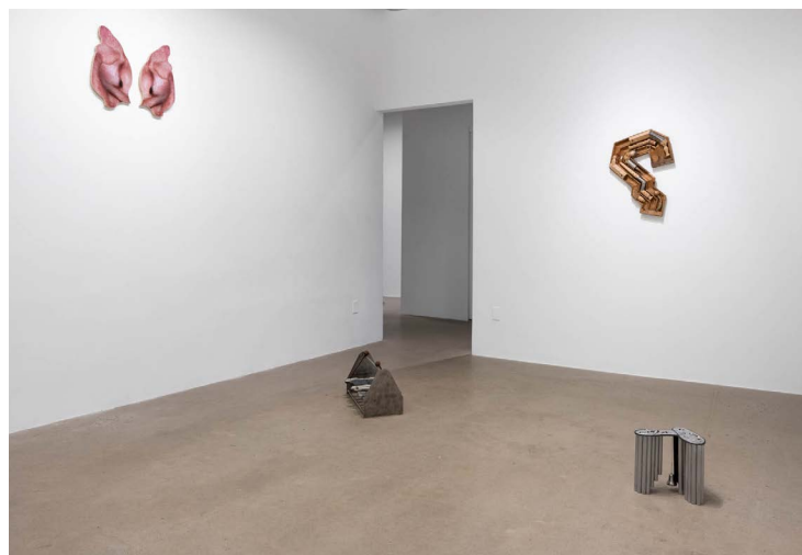
Tegan Moore, Condensations , 2025 Shannon Garden-Smith, Snail work, or give the colours what turns you please , 2025 Émilie Allard, Point d'ironie point d'orgue , 2024